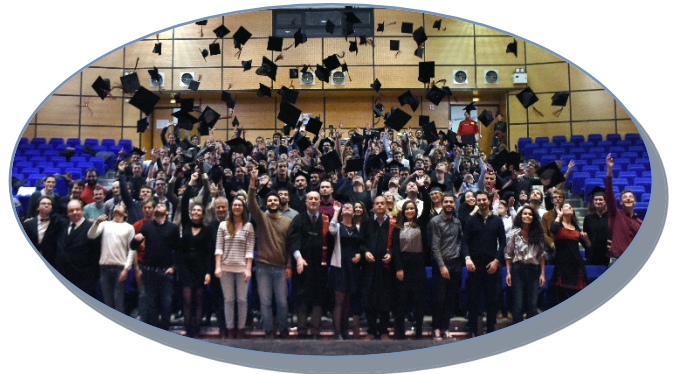
REMISE DIPLOMES 2017