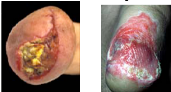
Surinfections locales du moignon

113) Une augmentation du volume du moignon et des douleurs peuvent également résulter d'un hématome , survenant en post opératoire ou après un traumatisme local (lors d'une chute sur le moignon, par exemple). Un drainage chirurgical peut être nécessaire. Une adaptation du traitement antalgique est également réalisée.